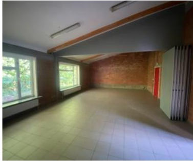
Lokaal twee en drie (muurscheiding)