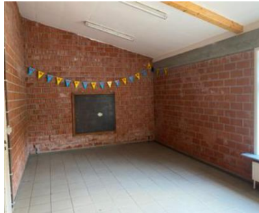
Lokaal zes (hoeklokaal)