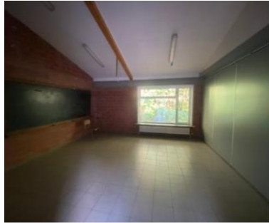
Lokaal 1 (muurscheiding)