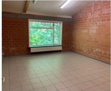
Lokaal vier (hoeklokaal)