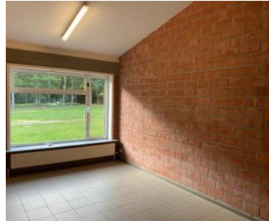
Lokaal vijf (hoeklokaal)